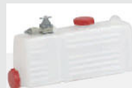
Бак для химических составов из полиэтилена, ёмкость 10л. SWINFOG SN 50-10