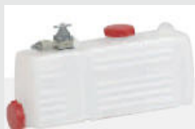
Бак для химических составов из полиэтилена, ёмкость 6,5л. SWINFOG SN 50 PE