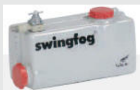
Бак для химических составов из нержавеющей стали, ёмкость 6,5л. SWINFOG SN 50