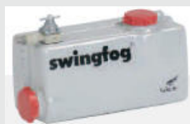
Бак для химических составов из нержавеющей стали, ёмкость 9л. SWINFOG SN 50-10