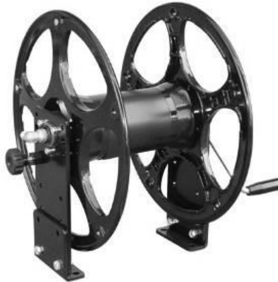
Рис. 7. КАТУШКА.

1. Ручка. 2. Штанга. 3. Распылитель. 4. Вариант специальной комплектации