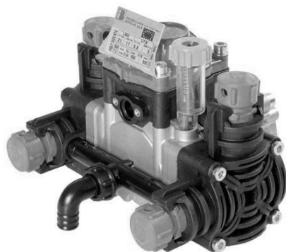
Рис. 3. Насос Bertolini POLY 2020.

4.5. Катушка (рис. 7) предназначена для намотки шланга и его перемещения к месту работы, а также для хранения шланга. Катушка состоит из рамки (поз. 1, 2) и барабана (3), посаженного на вращающуюся ось с рукояткой (5).